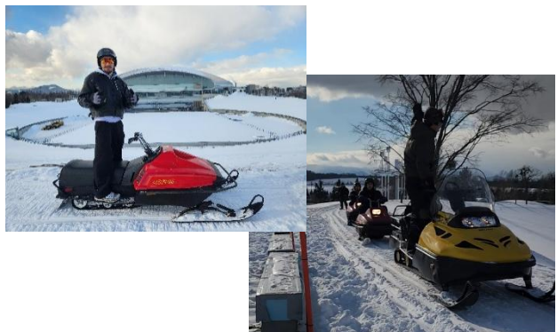
スノーモービルツアーの様子