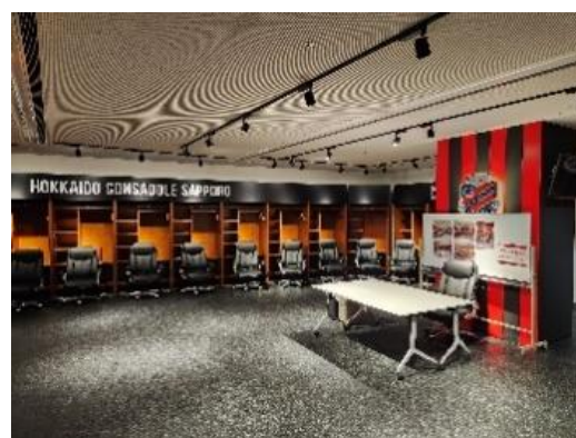
▲選手ロッカールーム