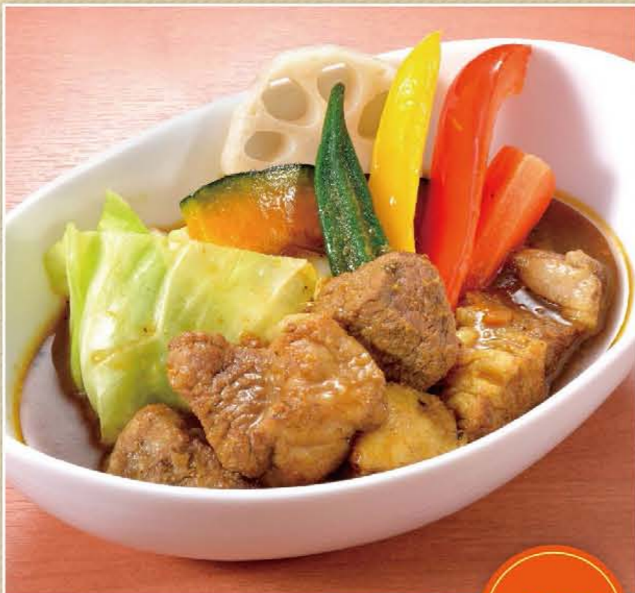
牛バラ入りスープカレー