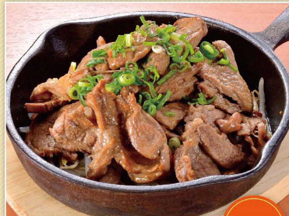
ジンギスカン定食