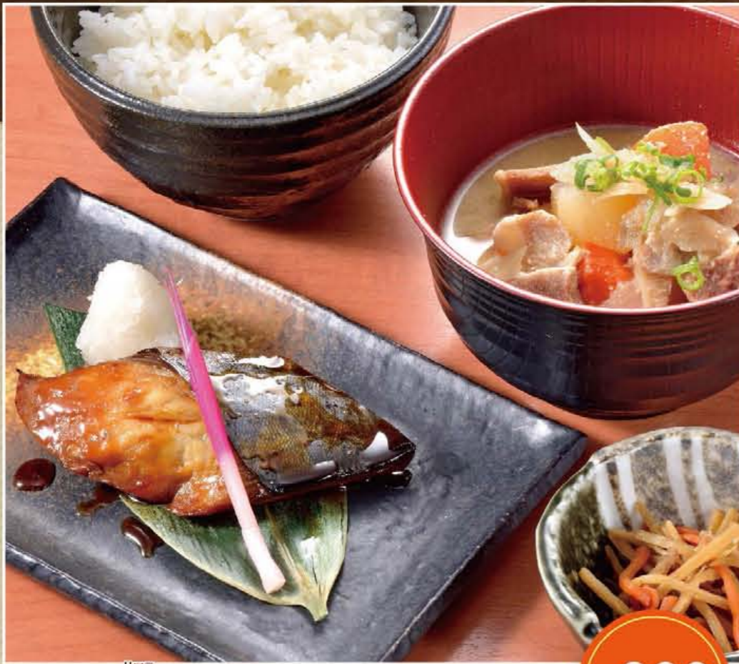
リッパ 鱈の照焼きと豚汁定食