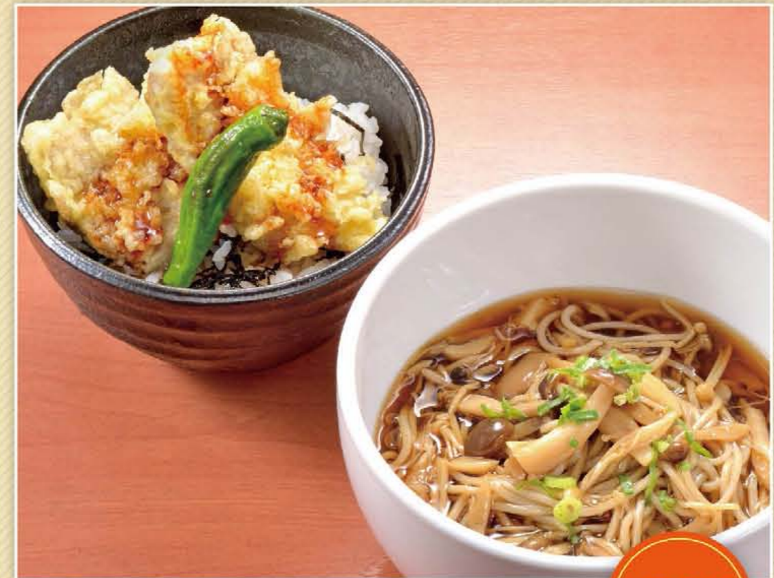
きのこあんかけそばと豚天丼